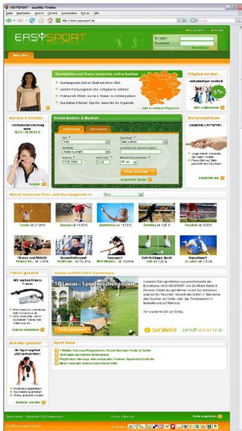
Easysport.de: Sportstätten und -kurse schnell finden.

edicos realisiert für die e-sports GmbH ein leicht nutzbares, flexibel gestaltetes Portal mit integriertem Reservierungssystem. Die neue Plattform, www.easysport.de , bringt Deutschlands Betreiber von Sportstätten und Freizeitsportler zusammen und schafft Transparenz im Markt.