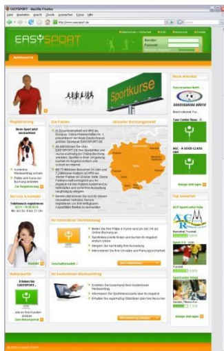
Das Anbieterportal: Informationen auf einen Blick - übersichtlich und einfach

Anbieter können sich im Portal professionell gegenüber einer ständig wachsenden Community darstellen und über Web Analytics sowie Bewertungen Rückmeldungen zu ihrem Angebot erhalten. Stammdaten und Bilder können sie eigenständig pflegen und einzelne Plätze in der Anlage individuell freigeben oder blockieren. Um die Nachfrage besser zu regulieren, lassen sich Preise und Rabatte auch kurzfristig anpassen. Eine integrierte Applikation zeigt den Betreibern detaillierte Buchungsinformationen, und hilft so, Auslastungen besser zu planen. „Betreiber und Trainer erhöhen über easysport.de die Reichweite ihres Angebots deutlich und werden von Kunden wahrgenommen, die sie mit ihrer eigenen Webpräsenz oder über die Gelben Seiten bisher nicht erreichen konnten“, erläutert Robert Ragge die geschäftlichen