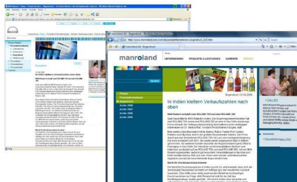
Content-Migration: Eine Pressemeldung, vorher und nachher

Dank der schnellen Migration verlief die manuelle Nachbearbeitung einiger Inhalte und Strukturen im RedDot CMS sowie auch die Schulung der Redakteure und Administratoren durch edicos ohne Zeitdruck. Die Abnahme durch die Fachabteilungen konnte so noch deutlich vor dem geplanten Go-Live-Termin erfolgen.